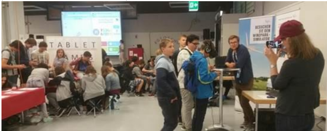
Le GEOSchool Day 2016 a été un succès.

Ce serait magnifique si les entrepreneurs de la Suisse Romande pouvaient s'engager et pouvaient promouvoir cette manifestation dès à présent dans le cadre des écoles!